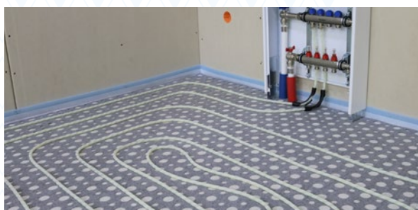
Rohr mit Klettbefestigung