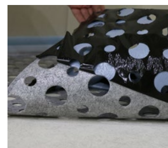
Selbstklebend nach Abzug der Folie auf vorbehandeltem Untergrund